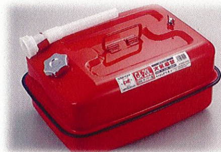
ガソリン・軽油・灯油等

※軽油用ポリエチレン容器は令和3年7月現在、危険物保安技術協会の認定品はないため、使用者の責任において使用してください。