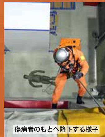
傷病者のもとへ降下する様子

主棟東側内部は3階まで吹き抜けになっており、天候や時間帯を問わず、高低差を生かした訓練ができます。