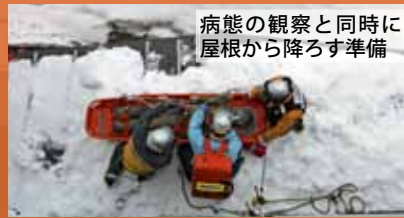
病態の観察と同時に屋根から降ろす準備