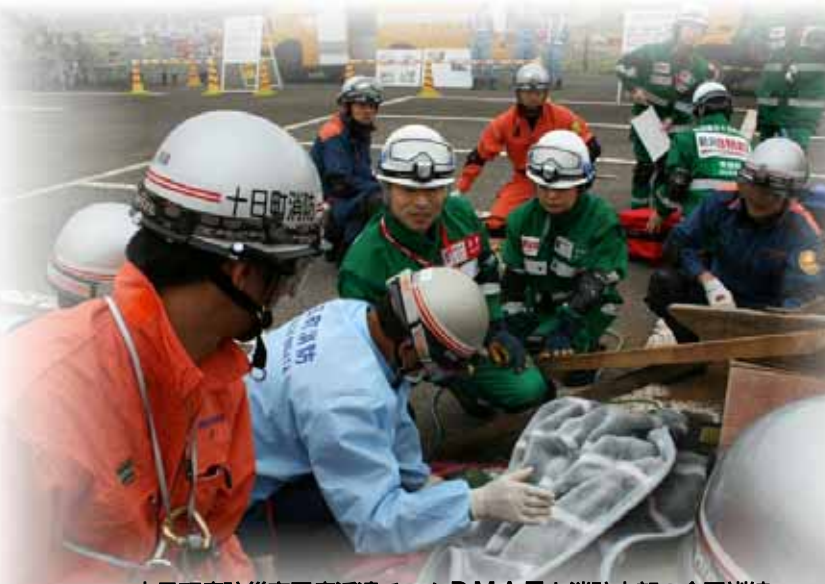
十日町病院災害医療派遣チームDMATと消防本部の合同訓練 (十日町市総合防災訓練)

この協定は救急現場において、医師による医療処置が必要ときに、十日町病院の医師などの派遣を要請するもので、複雑多様化する災害などに消防と医療が連携し、救命率の向上を目的とするものです。