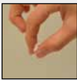
食塩 1~2g (ひとつまみ)