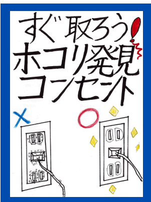
令和7年度最優秀賞

問合せ・宛先 十日町地域消防本部 予防課 〒948-0007 十日町市四日町新田1041番地 電話：025-757-1557 Mail：tfd119@tokamachi-kouiki.jp