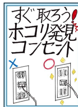
昨年度最優秀作品