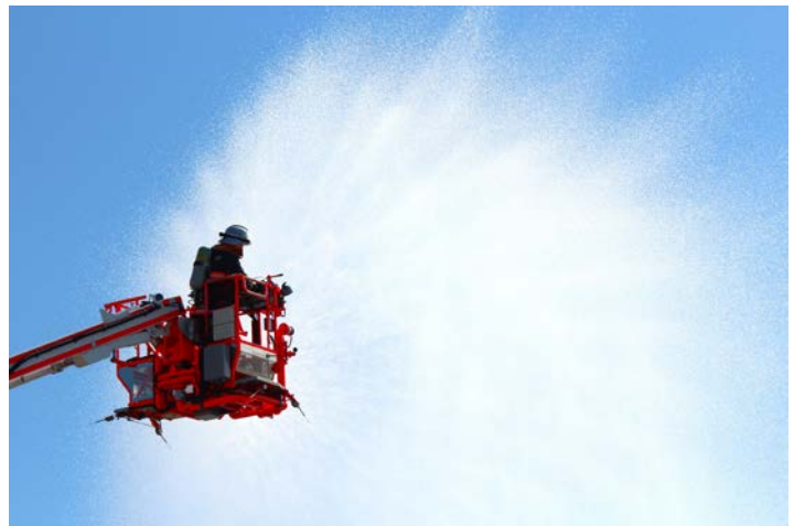
はしご車を使用した放水訓練