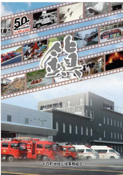
十日町地域広域事務組合 発足 50 周年記念誌

この消防年報は、令和5年中の十日町地域広域事務組合の主要な消防業務と現有消防力全般にわたる事項を収録し、消防状況の逐年傾向を把握するため、特に必要なものについては、過去にさかのぼり累年表を加え編集しました。