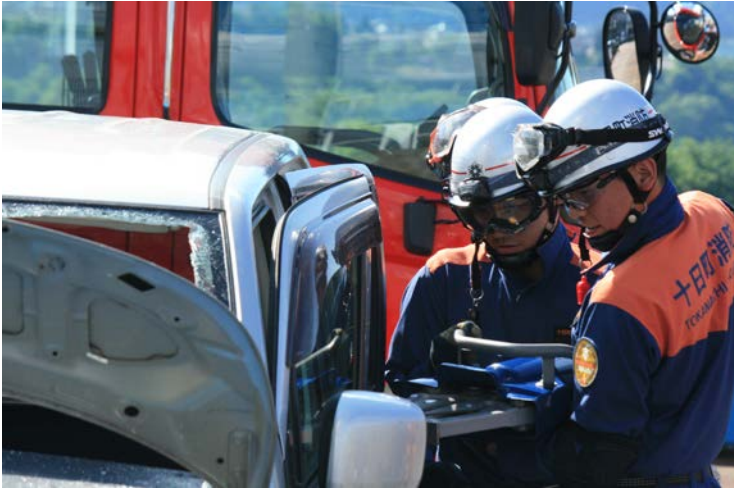
事故車両からの救出を想定した車両破壊訓練