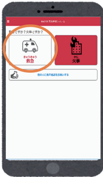
きゅうきゅう かじ せんたく 救急か火事を選択