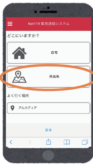
ばしょ せんたく 場所を選択