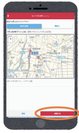
ばしょ ちざうしん 場所の地図送信