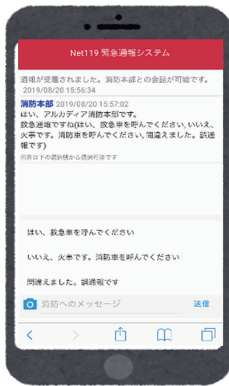
かいはかのう チャットで会話可能