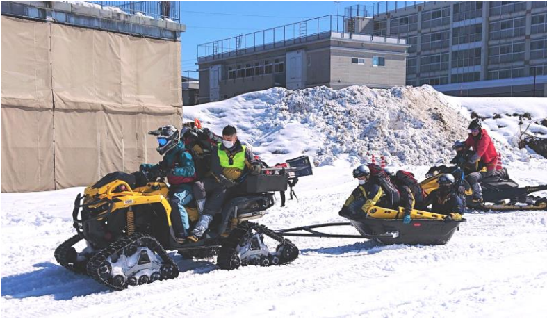
オフロードビークル協会との連携訓練