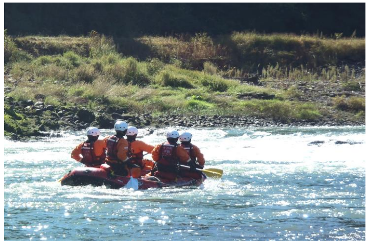
水難事故を想定した水難救助訓練